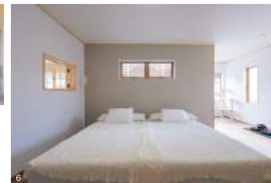
5. キッチンに隣接する広々としたランドリーでは、「干す」「たたむ」「仕舞う」をストレスなく行える。お天気次第では自然光で乾かせるのもうれしい。6. キュートな出窓付きの寝室。奥には、トレーニングルーム兼キャットスペースも。7. 脱衣所を省スペースに抑えたぶん、お客様も使う洗面台は空間を分けた。8. 採光と広見の効果が玄関ドア正面の窓。効果的に配した壁は視線をカットし、大容量のシューズクローゼットを実現。