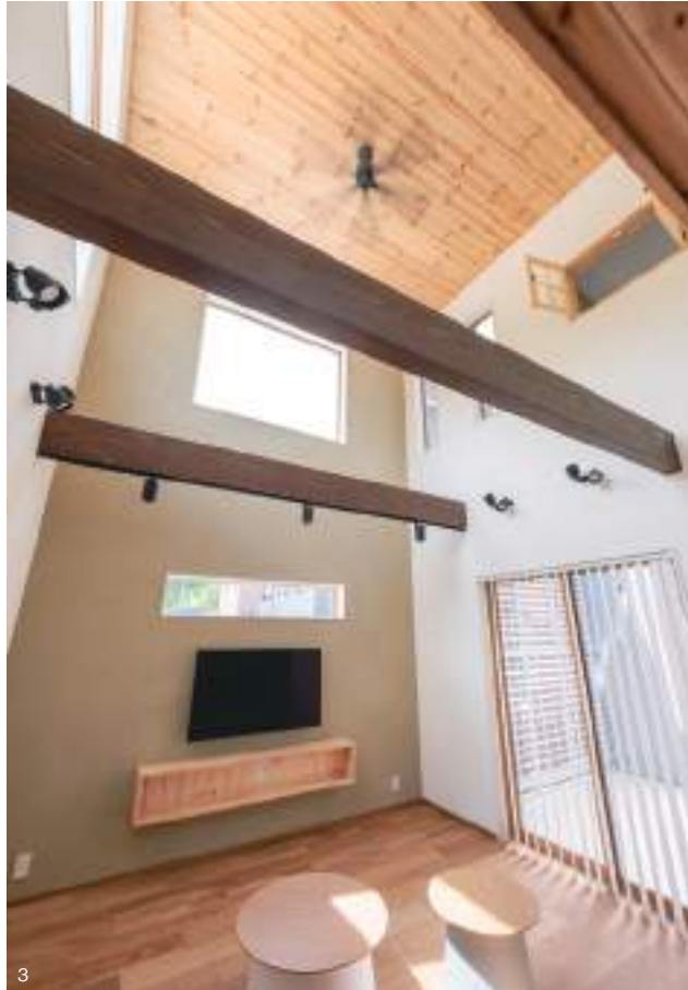
1. 床と天井に天然木を使うことで空間に統一感を生み出し、木に包まれるような心地よさを感じるLDK。視線を遮る棚や柱がないため、広い空間に一層の開放感を生み出している。 2. 中庭には横軸の目隠しスクリーンを備え、プライバシーにも配慮。3. 大きな吹き抜けのアクセントになっている梁は、将来2階の増築が必要になった際の布石にも。4. スクエアなフォルムとシャープな素材感のガルバリウム鋼板でスタイリッシュに仕上げた外観。絶妙なアシンメトリーさで個性を創出。